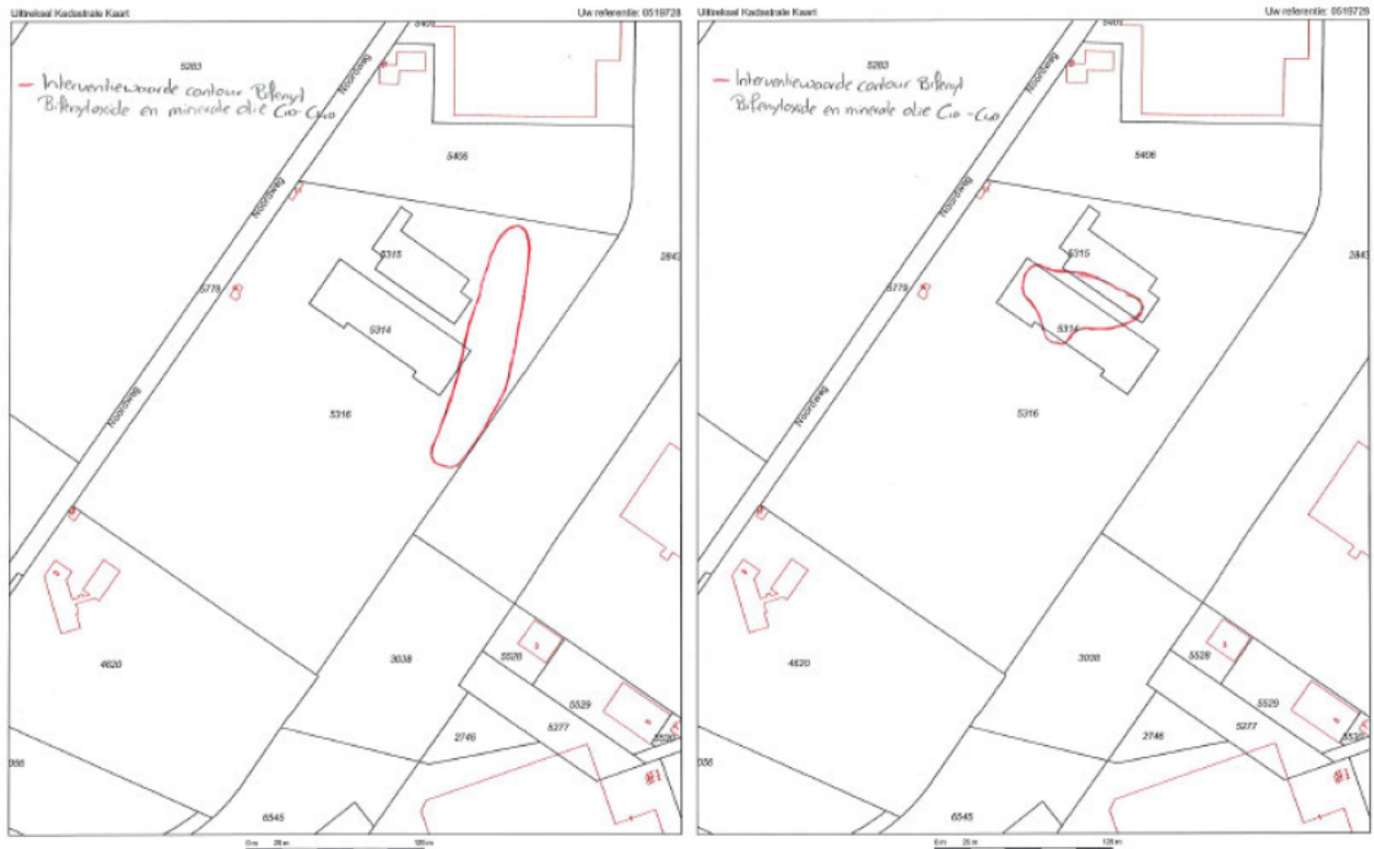
Deellocatie A: contour sterke verontreiniging