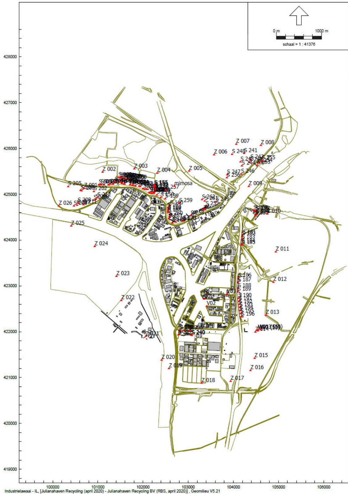
Overzicht van het rekenmodel met de ligging van de zonepunten