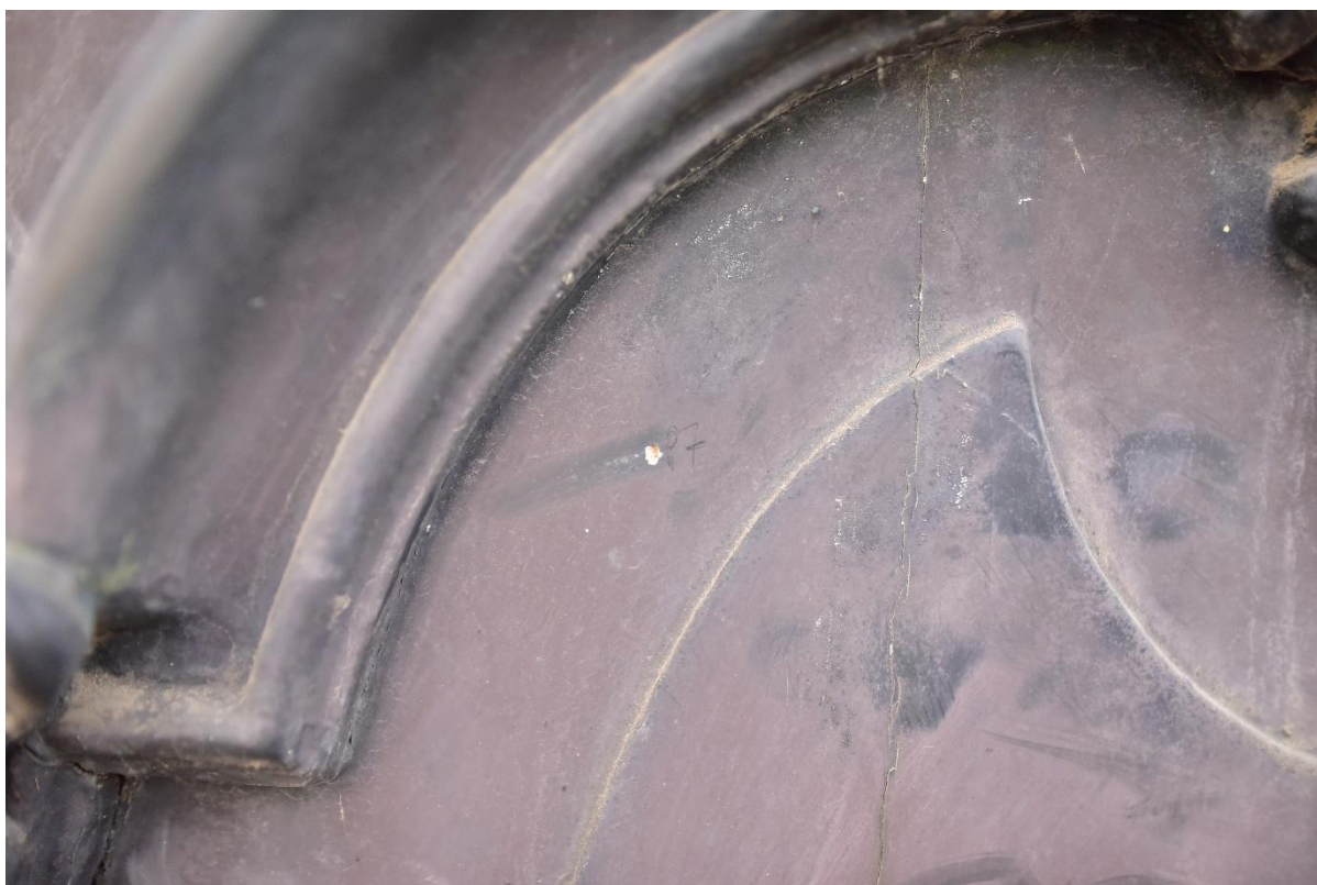
Figuur 13. Punctie 7 ter verkenning van S3