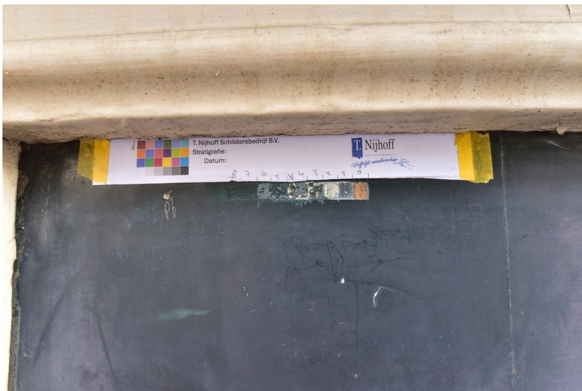
Figuur 5. Stratigrafie 3 hoog op de voordeur