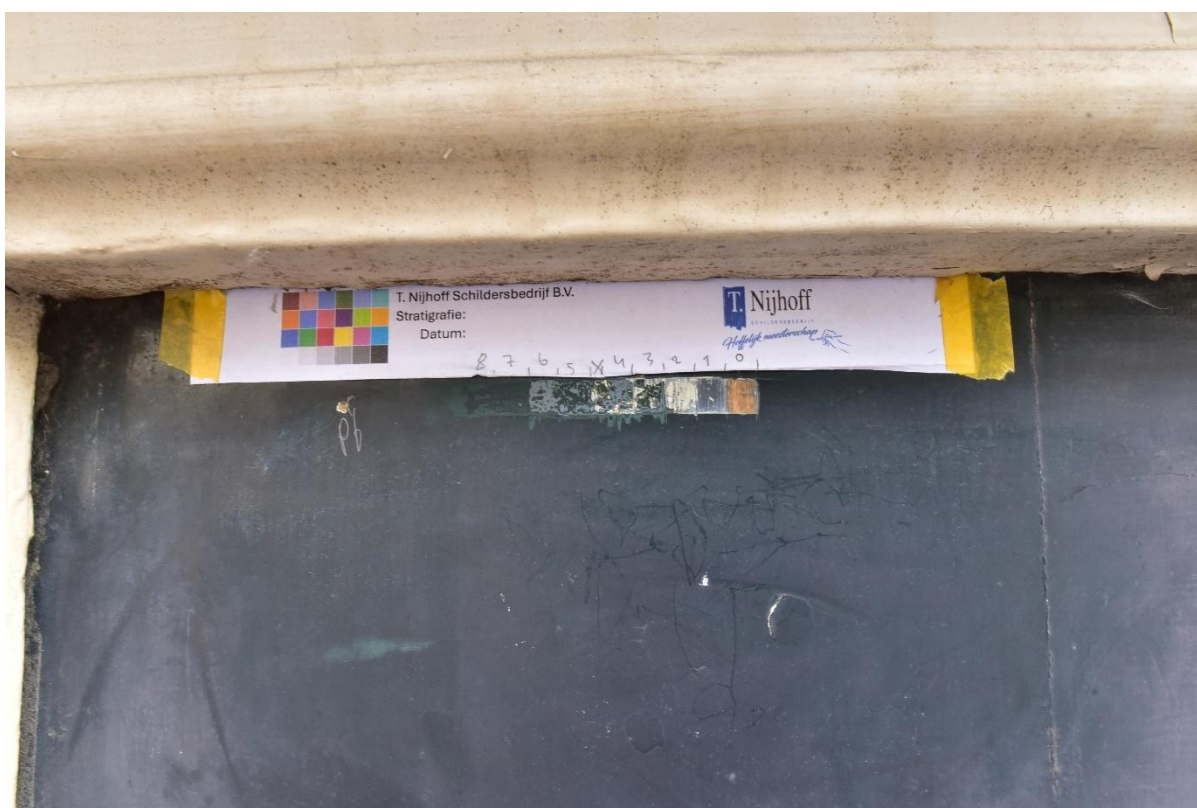
Figuur 12. Punctie 6 verkennende punctie S3