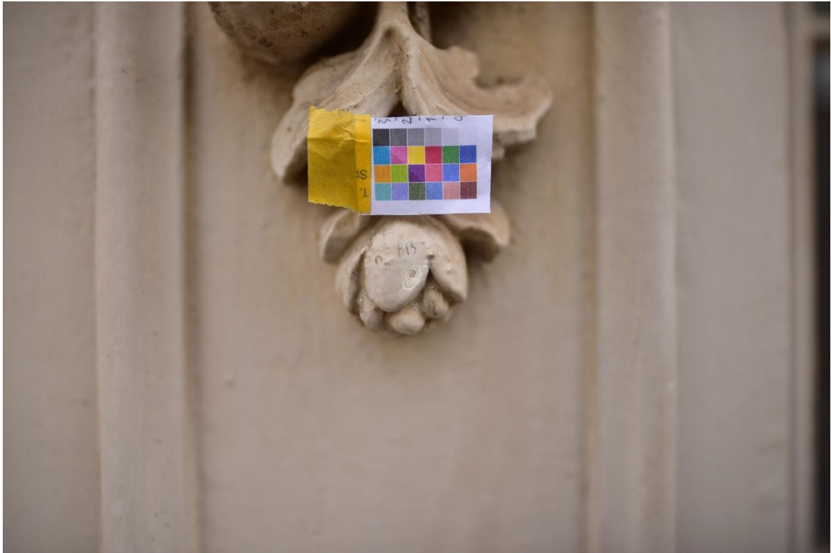
Figuur 17. Punctie 13 vergelijkende punctie snijwerk console