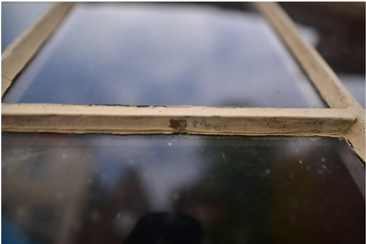
Figuur 16. Vergelijkende punctie op stopverf rand op oud glas