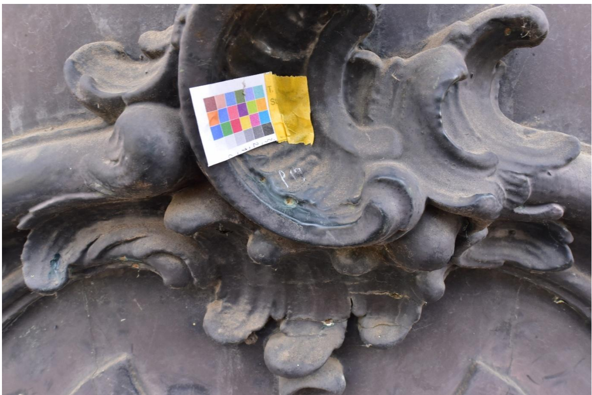
Figuur 22. Punctie 19 vergelijkende punctie op snijwerk deur, lichtere groene kleur aangetroffen