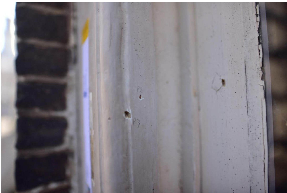
Figuur 10. Punctie 2 en 3 ter verkenning van S1