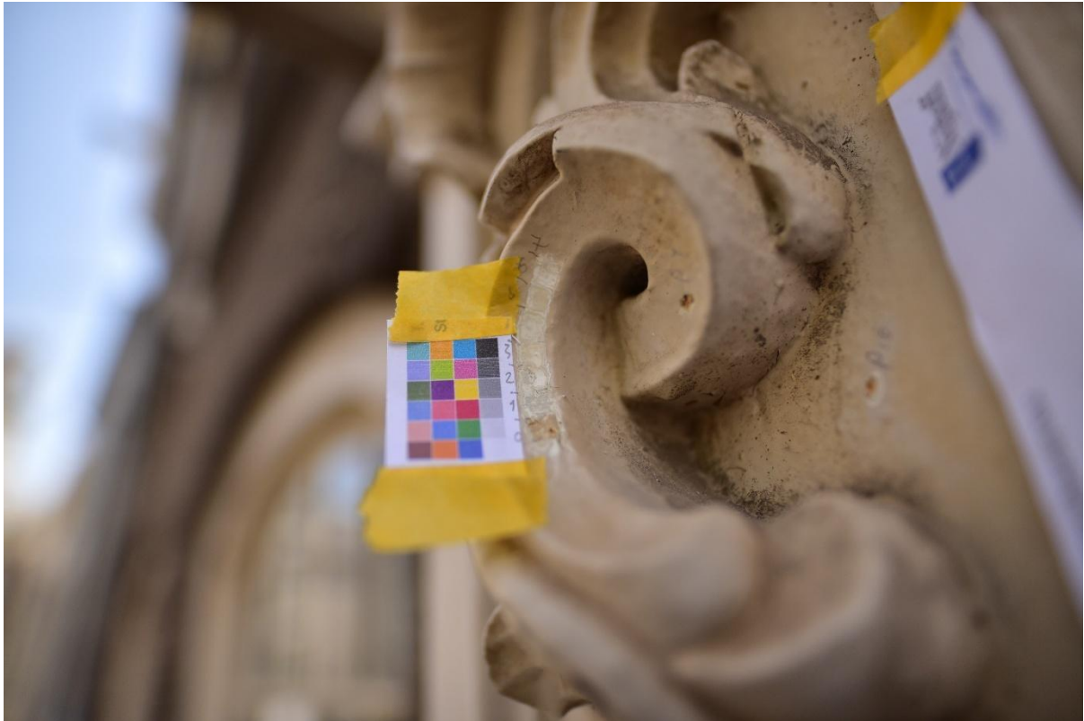
Figuur 7. Detailfoto stratigrafie 4 in het snijwerk