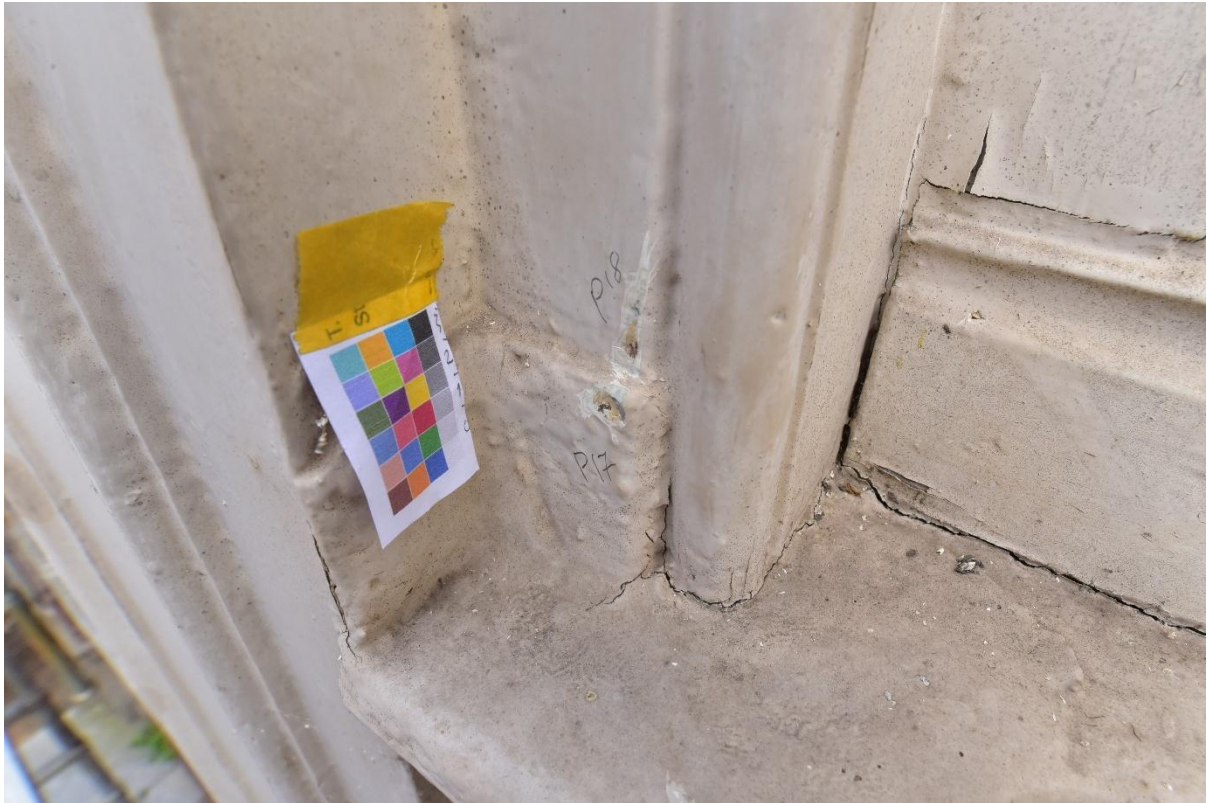
Figuur 21. Vergelijkende puncties op loodwerk en lijstwerk boven deur