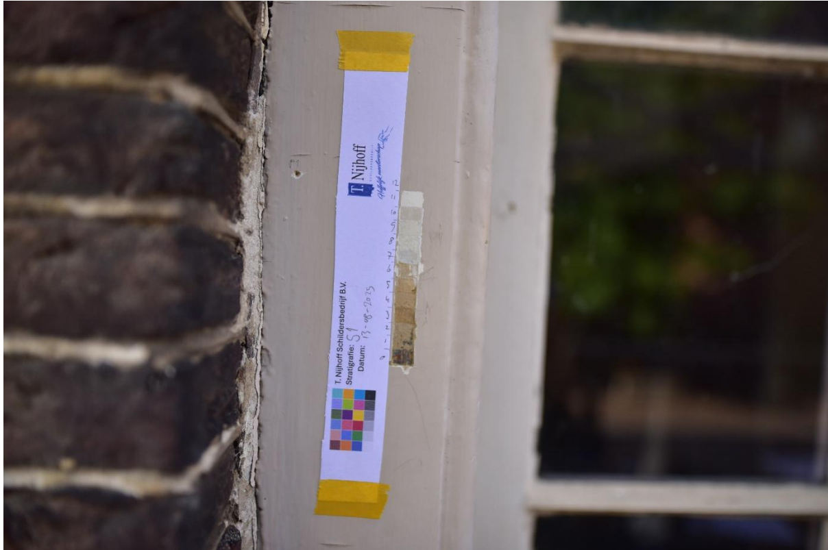
Figuur 2. Stratigrafie 1 op het raamkozijn links van de voordeur