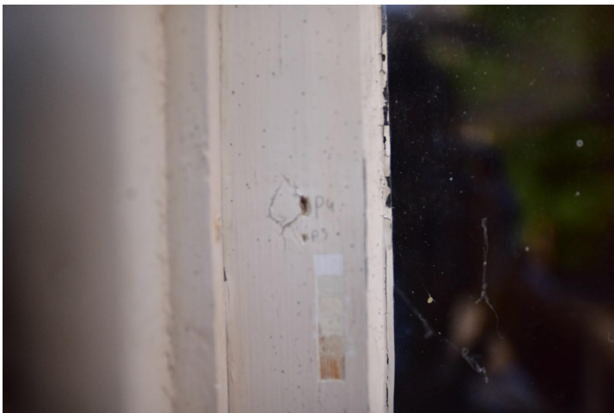
Figuur 11. Puncties 4 en 5 ter verkenning van S2