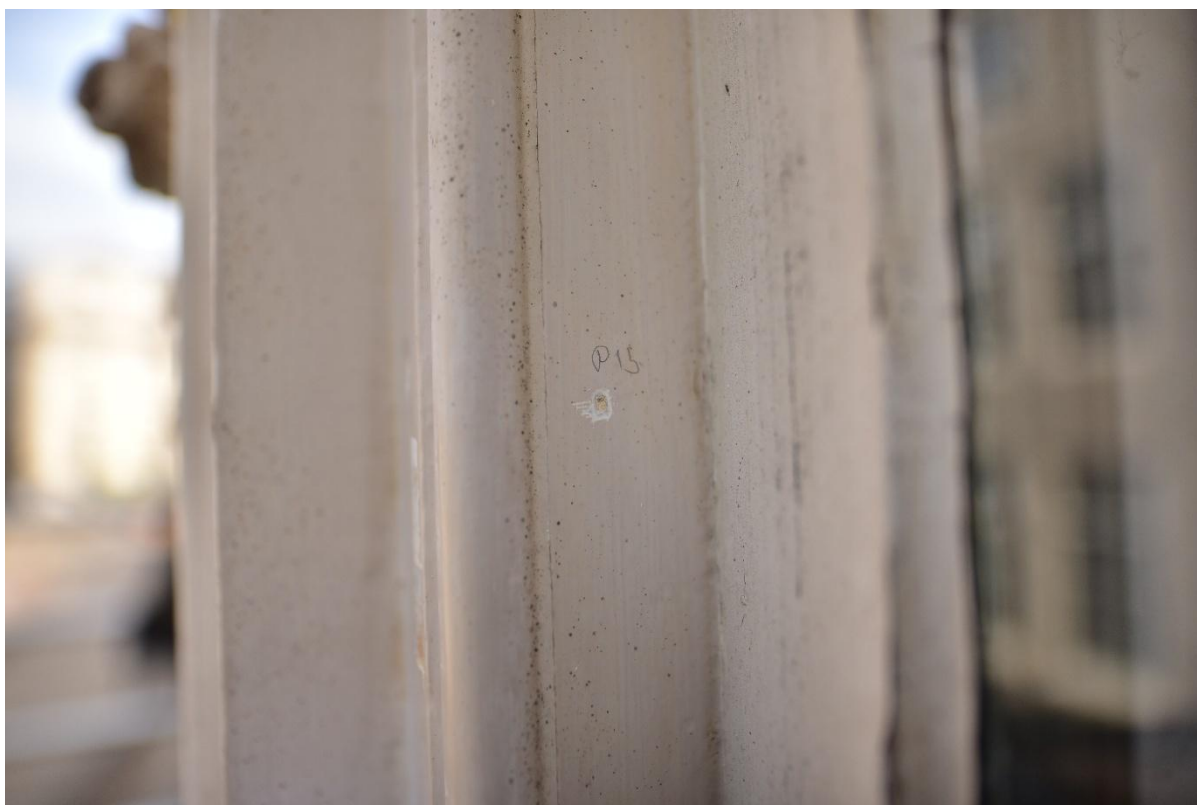
Figuur 19. Punctie 15 verkennende punctie S5