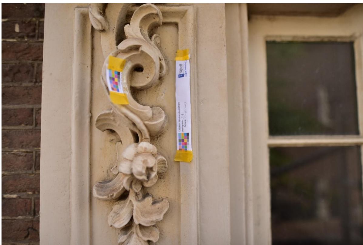
Figuur 6. Stratigrafie 4 op het snijwerk van de console in het lijstwerk rondom de deur