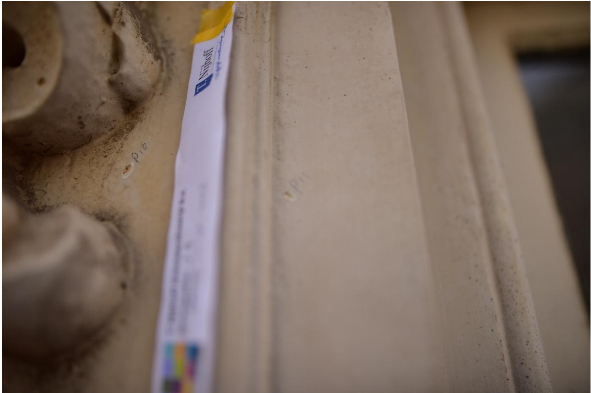
Figuur 15. Puncties 10 en 11 vergelijkende puncties lijstwerk