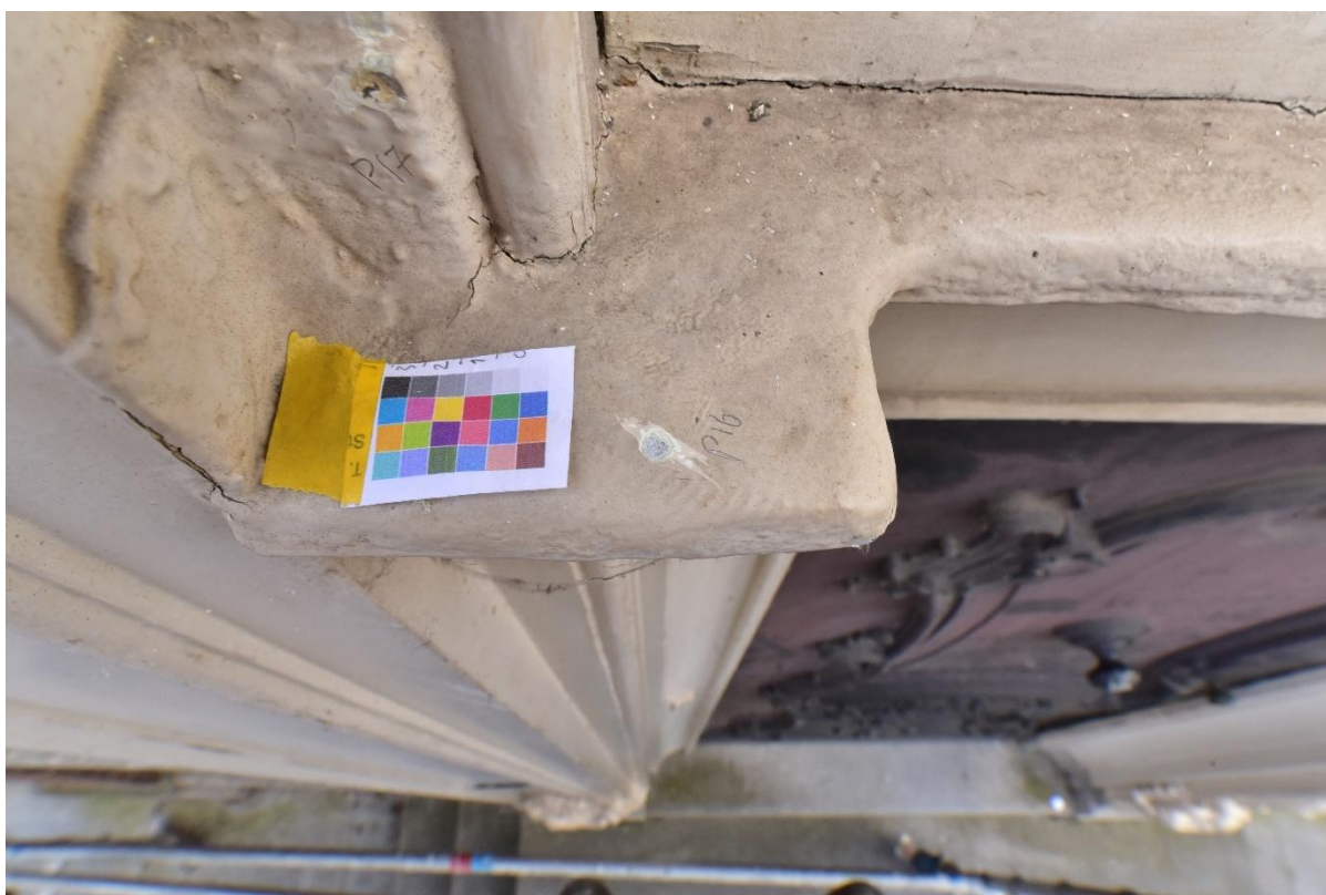
Figuur 20. Punctie 16 vergelijkende punctie op loodwerk boven deur