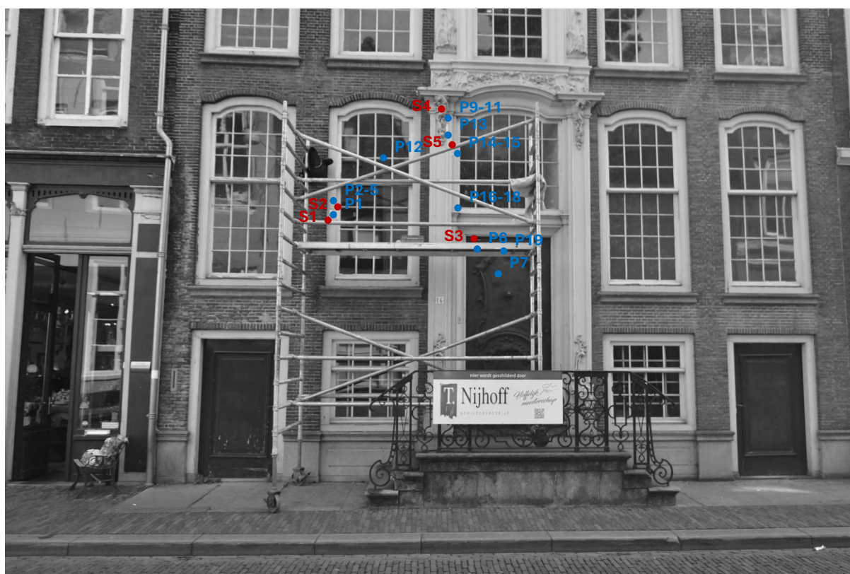
Figuur 1. Locaties van de stratigrafieën (rood) en Puncties (blauw)

De onderstaande afbeelding geeft de locaties van de stratigrafieën in rood en de puncties in blauw aan; deze zijn bij benadering, voor een verduidelijking en/of de exacte locaties kunnen de foto's van de stratigrafieën en puncties raadplegen in de bijlagen.