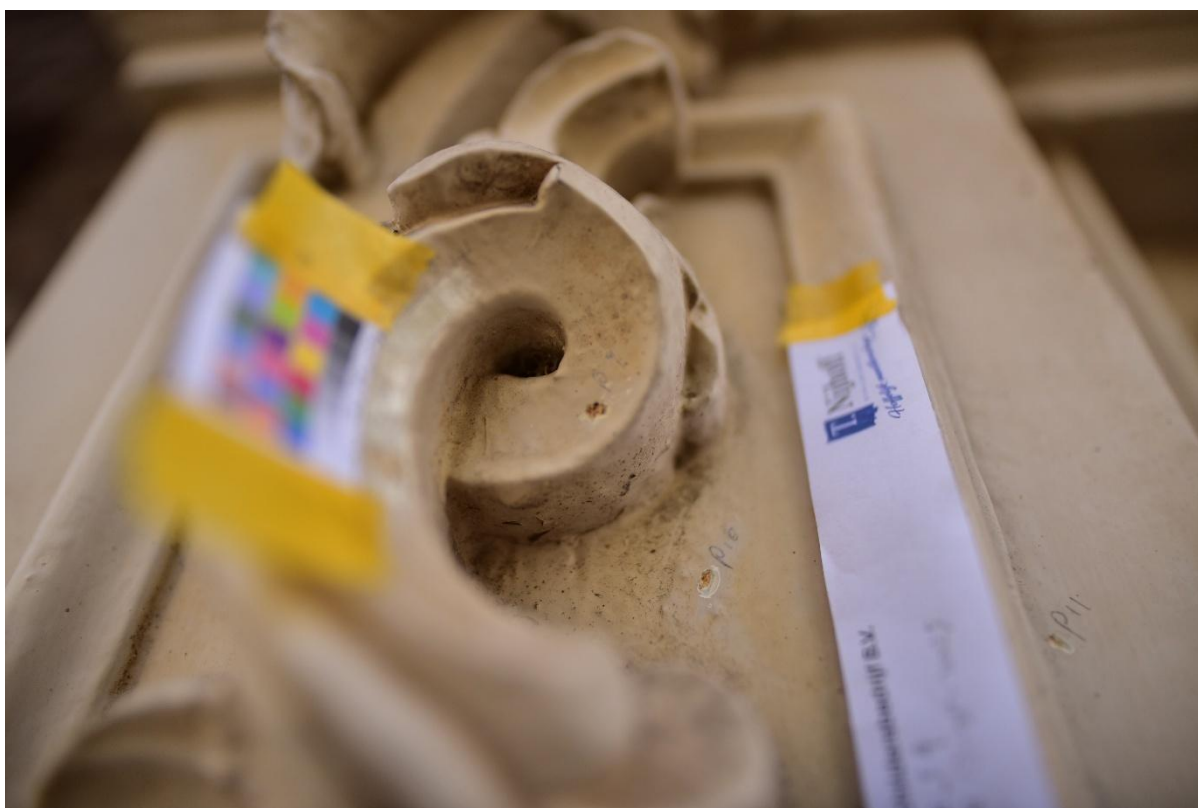
Figuur 14. Puncties 9, 10 en 11 vergelijkende puncties op lijstwerk en console