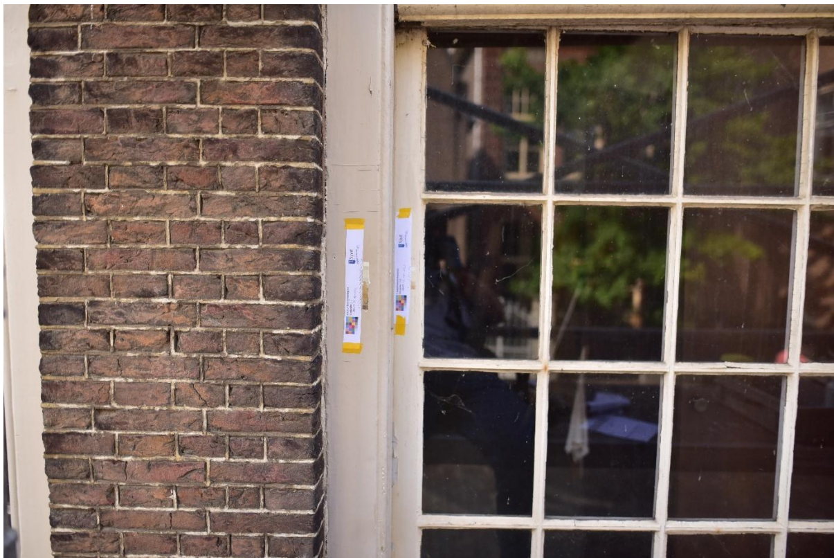
Figuur 4. Overzichtsfoto waarop de locaties van S1 en S2 zichtbaar zijn