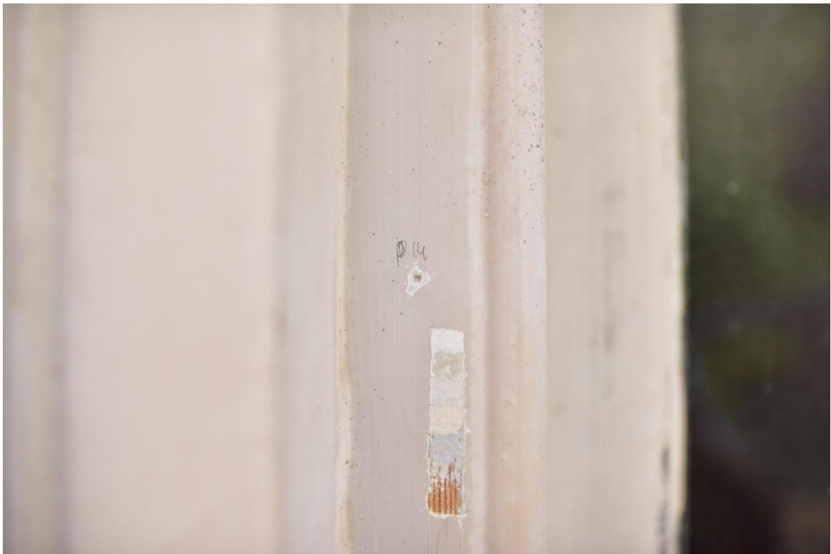
Figuur 18. Punctie 14 verkennende punctie voor S5