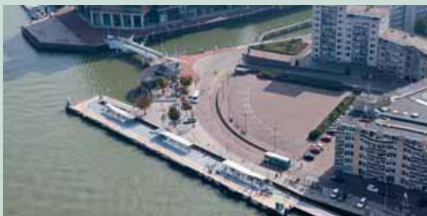
FIGUUR 2: BLEIJENHOEK.

Er zijn geen risico's meer te verwachten (blootstelling, verspreiding), ook niet als IBC-maatregelen (damwand) geleidelijk hun functie verliezen. In termen van de Circulaire bodemsanering 2013 is sprake van een grote, stabiele restverontreiniging. De actieve nazorg kan in 2020 definitief worden beëindigd.