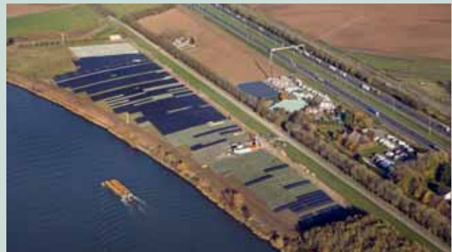
FIGUUR 3: TRANSBERG.

Door middel van nader onderzoek naar de verspreiding en risicobeoordeling van kritische parameters, inclusief de condities voor afbraak (benzeen) en vastlegging (barium, boor) wordt nu onderzocht of de verontreiniging "stabiel" is, in termen van de Circulaire bodemsanering 2013. Met de Omgevingsdienst zal de mogelijkheid van een alternatief stopcriterium worden besproken, dat beter aansluit bij de circulaire. Wat betreft de kwelsloot wordt onderzocht of een reactieve zone, bijvoorbeeld in de vorm van een helofytenfilter, de organische stoffen kan afbreken en de metalen immobiliseren. Deze alternatieven zullen na initiële kosten zo goed als zeker leiden tot versnelde afbouw van nazorg, en daardoor kostenbesparingen.