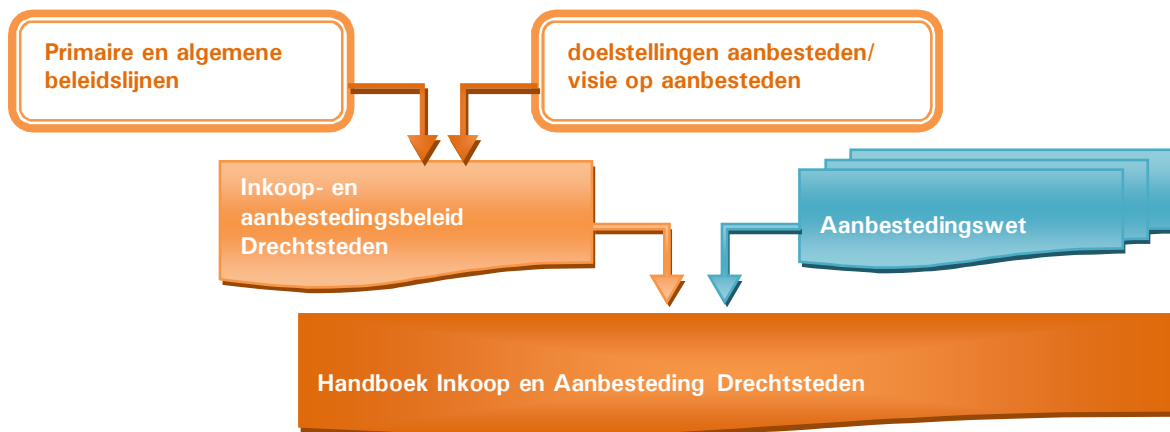
Fig. 2 Onderlinge verhouding beleid, wet en handboek

Het Inkoophandboek wordt opgesteld en actueel gehouden door team Inkoop en juridisch getoetst door het Juridisch Kenniscentrum van het Servicecentrum Drechtsteden.