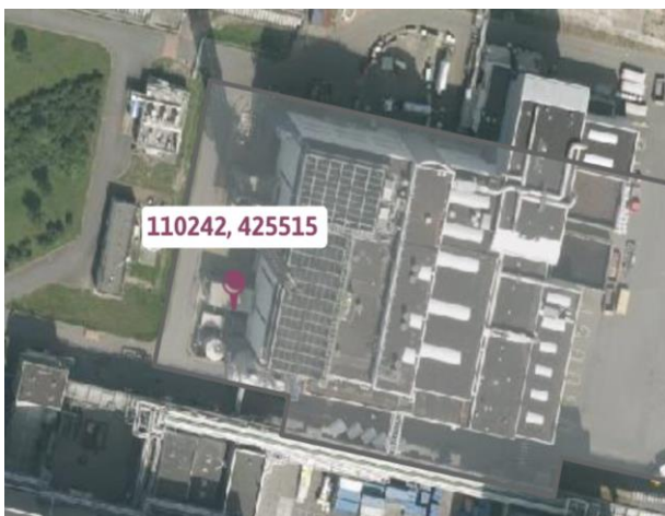
figuur 3: Locatie opslagtanks voor ammoniak

De SVI heeft twee bovengrondse opslagtanks (elk 20 m 3 ) voor ingekocht ammoniak. Dit ammoniak wordt in de SNCR/Denox-installaties van de SVI, AEC en ziekenhuisverbrandingsinstallatie (ZVI) toegepast om de luchtmissies van stikstof (NO x ) te reduceren. HVC is voornemens één tank zodanig aan te passen dat er ook ammoniak(k)-rijk afvalwater afkomstig uit de stikstofverwijderingsinstallatie in kan worden opgeslagen. Op onderstaande luchtfoto zijn de locatiecoördinaten van de twee tanks opgenomen.