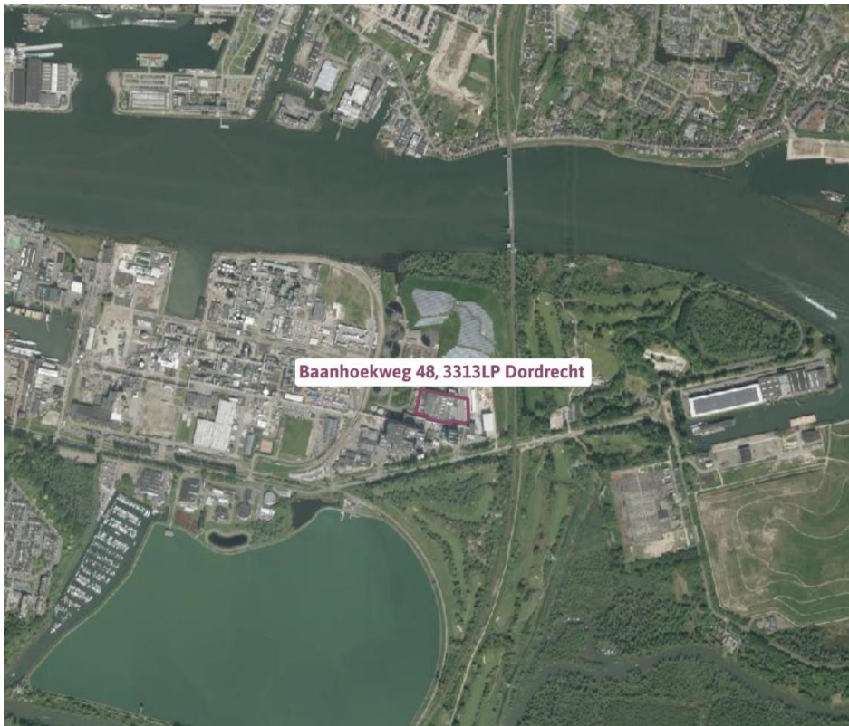
Figuur 5: Locatie SVI, HVC Dordrecht

De dichtstbijzijnde woningen bevinden zich aan de noordoostzijde van de locatie, aan de overzijde van de Beneden Merwede, in de woonwijk Baanhoek (gemeente Sliedrecht), op circa 900 meter afstand. Aan de zuidwestzijde, in de gemeente Dordrecht, liggen woningen op een afstand van circa 1100 meter.