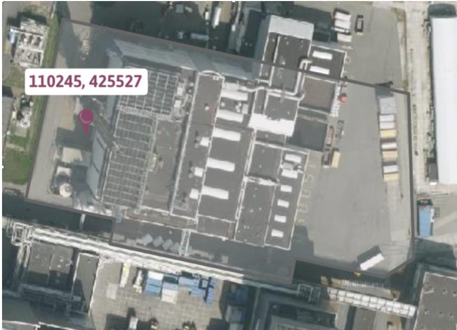
figuur 2: Locatie bovengrondse buffertank voor droogdamcondensaat