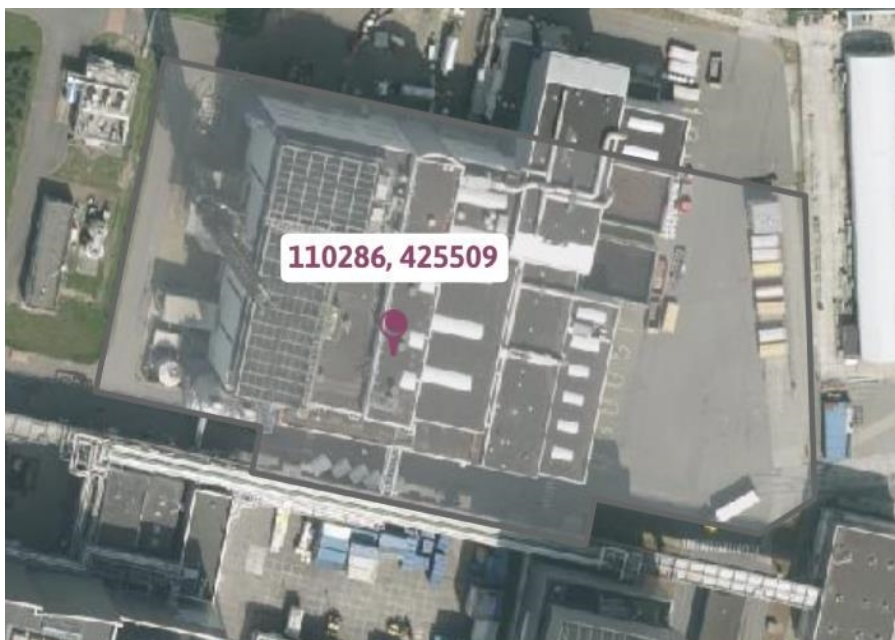
figuur 1: Locatie IBC's ijzerchloride en TMT

Voor het verladen van het ijzerchloride met een tankauto is een verladingspunt aanwezig. Voor het TMT zal er een tweede verladingspunt naast komen.