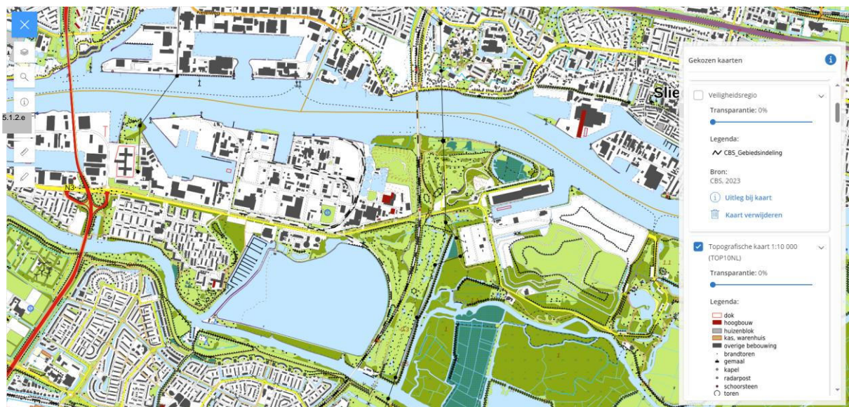
Figuur 4: Locatie HVC Dordrecht

De SVI van HVC Dordrecht is gelegen op het industrieterrein 'De Staart' gelegen aan de Baanhoekweg 48 te Dordrecht. De bedrijfslocatie grenst aan de AEC en de ZVI (beide onderdeel van HVC), Chemours Netherlands B.V. en Waterschap Hollandse Delta - RWZI Dordrecht en wordt aan de zuidzijde begrensd door de Baanhoekweg.